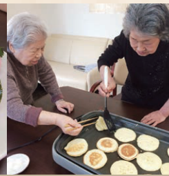
◆ パンケーキ ◆