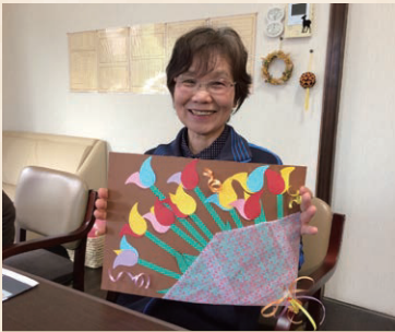
◆ チューリップ ◆

デイサービス笑いの家では積極的に工作レクに取り組んでいます。手を動かす工作は脳を活性化するので、効果的に心身の機能を維持する効果があるといわれています。それとともに、実際に何かを作るときには、たとえマニュアルがあったとしても、その場その場の工夫が必要となるので、試行錯誤による思考の訓練にもつながります。