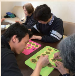
◆ クッキー ◆

作業療法の一環として「手づくりおやつ作り」に取り組んでいます。料理をすることによって脳が鍛えられ、情緒の安定・認知症の緩和が期待できると言われています。皆さん調理になるといつも以上に積極的に参加していただいております。