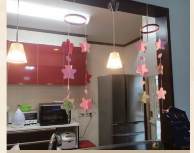
◆ 桜のさげもん ◆