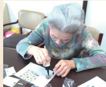
◆ レジンのキーホルダー ◆