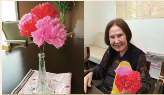
◆ カーネーション ◆