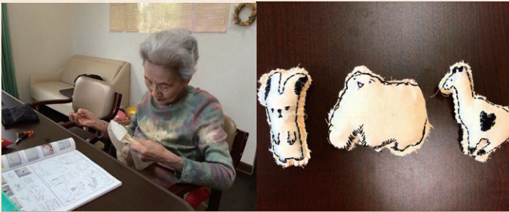
◆ 刺繍ブローチ ◆