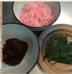
◆ さくらもち ◆